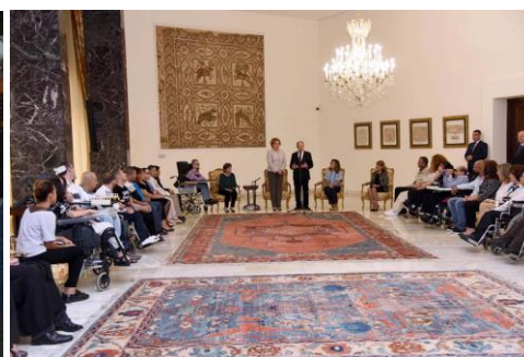
En visite au Palais Présidentiel