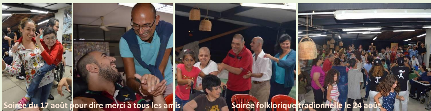
Soirée du 17 août pour dire merci à tous les amis